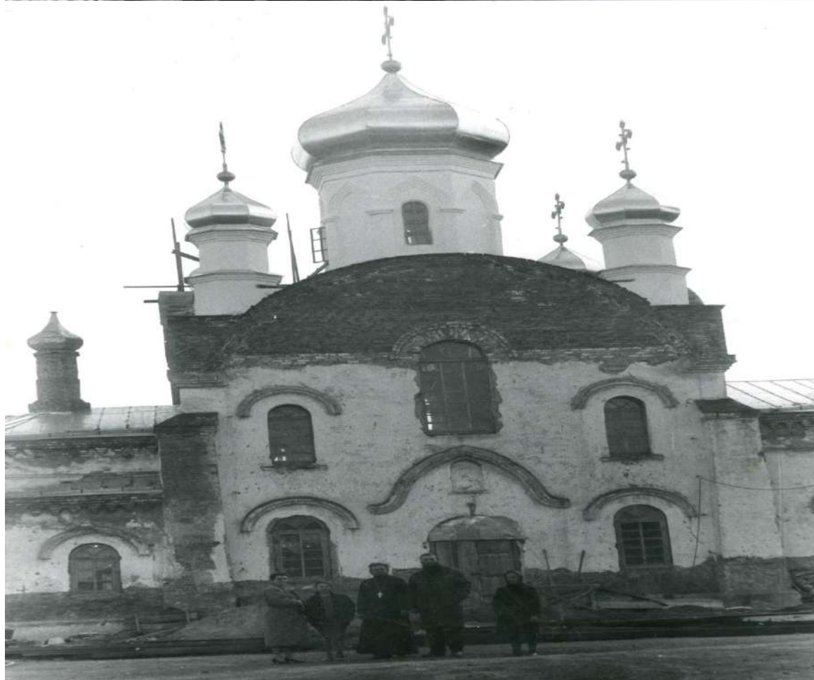
Реставрация храма 1992-1995 гг.