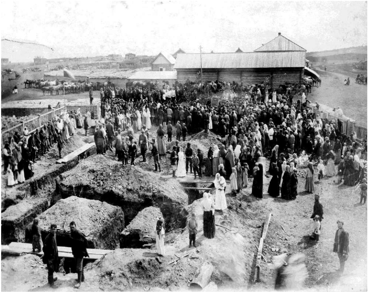
Закладка храма. 1908 г.