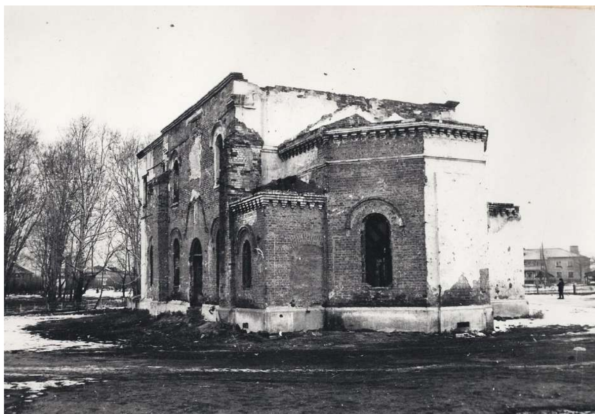
Разрушенный храм. 1980- гг.