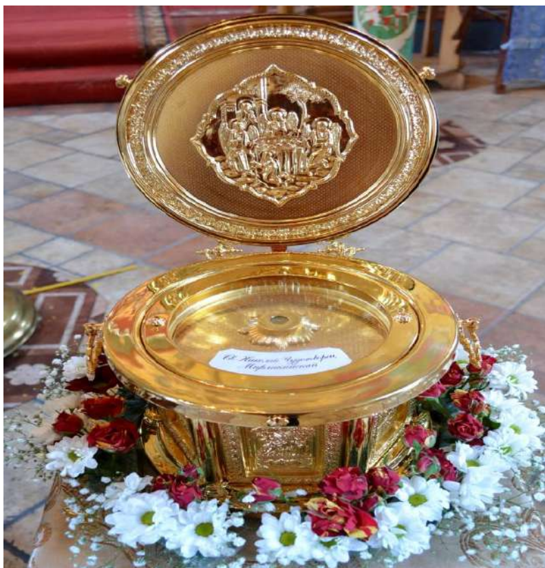
Святыни Троицког храма