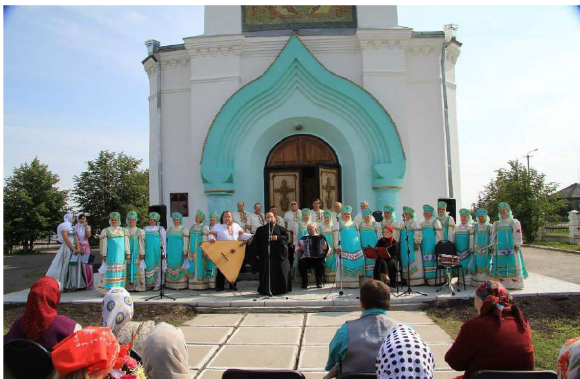
Народный хор с. Красного.