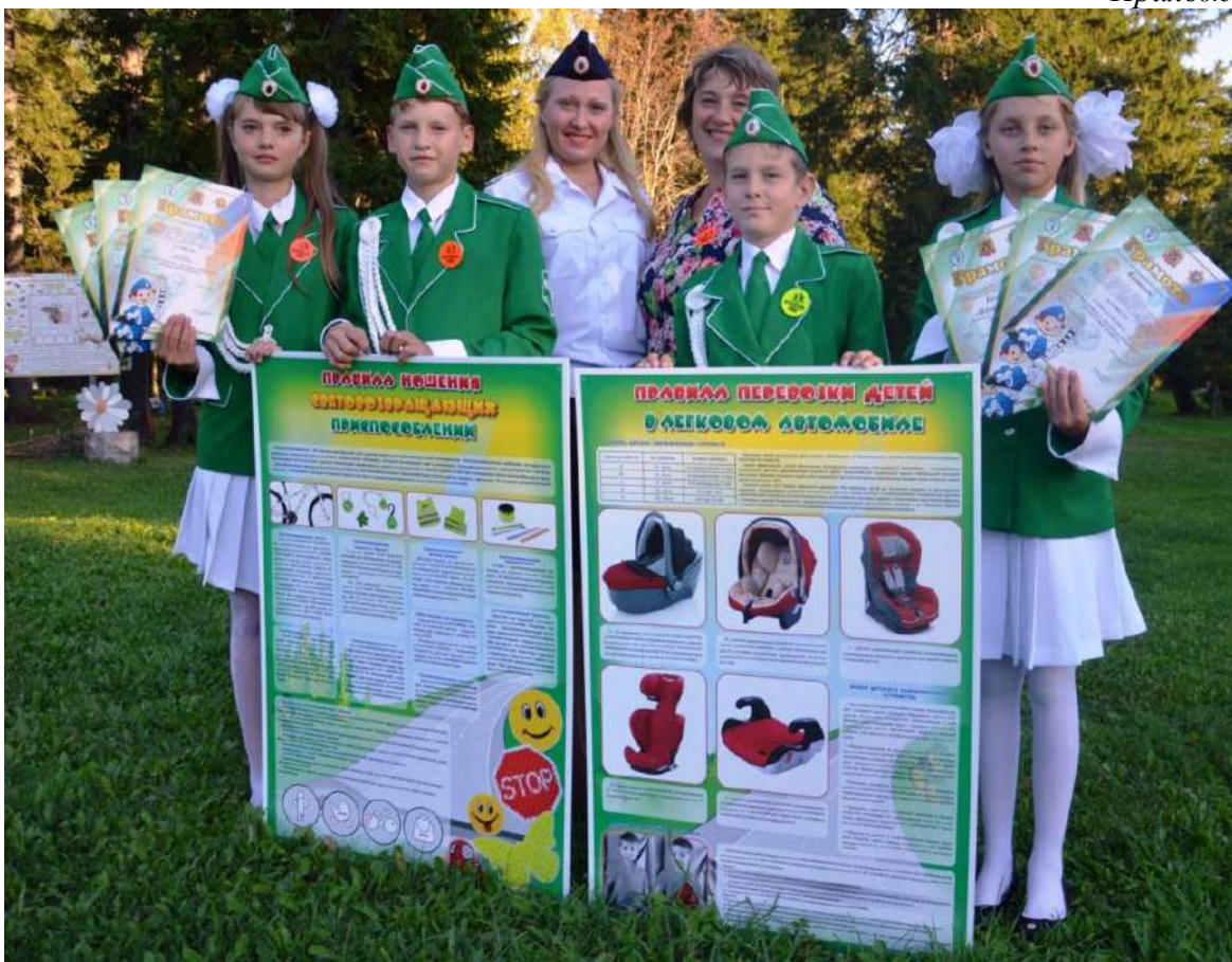
Представители отряда ЮИД «Идущие вперед» - участники областного конкурса-фестиваля «Безопасное колесо-2016»